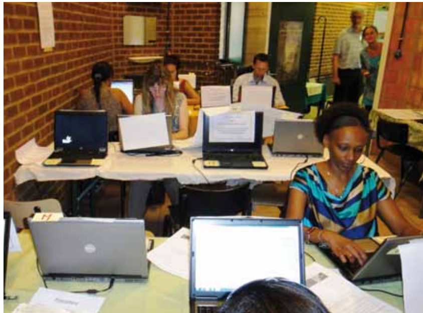
Salle de presse