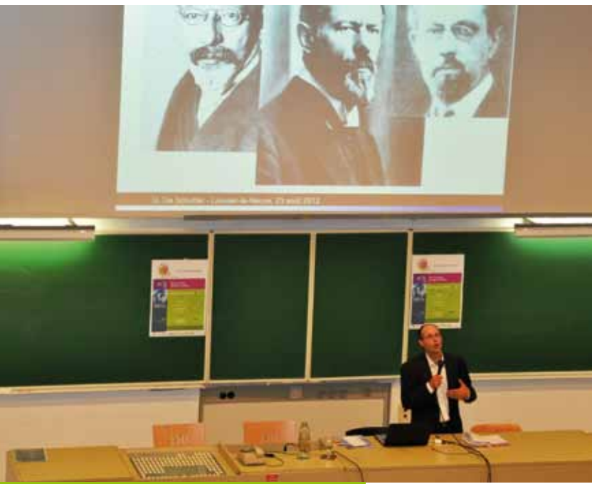
Olivier De Schutter

de ce processus dans « La grande transformation » (1944).