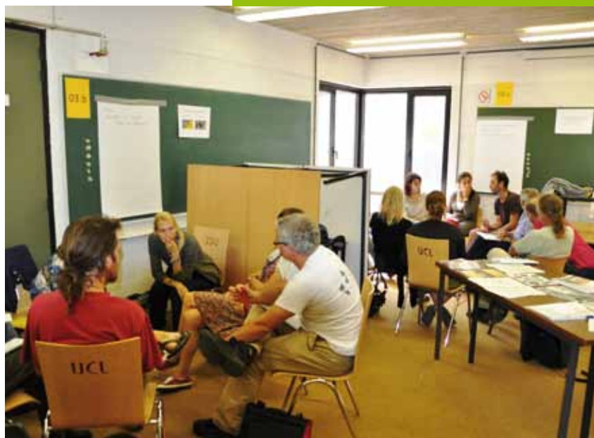
Atelier de l'Agora