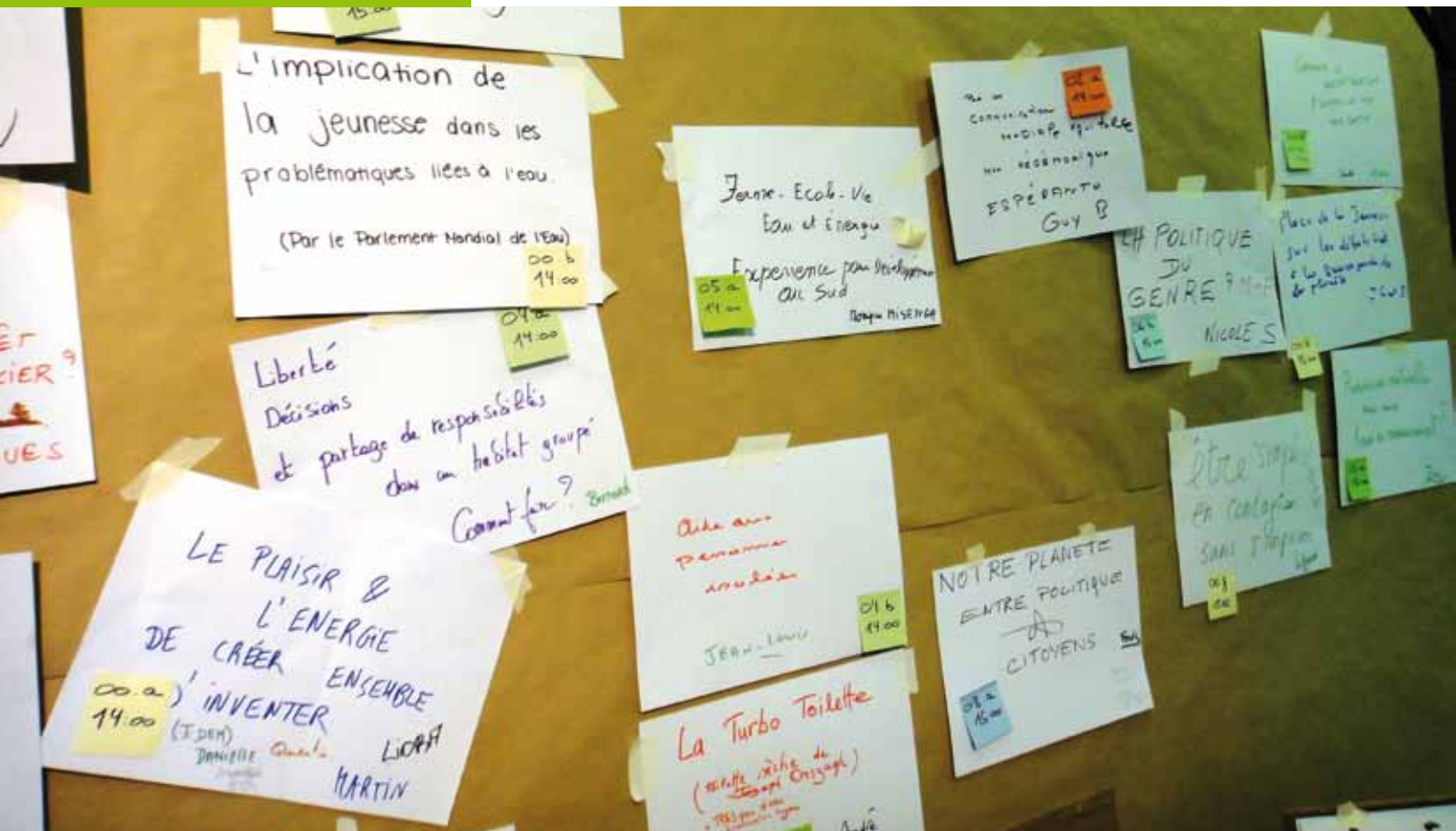
Mur d'affichage pour les ateliers proposés

N.B. Le DD est une nébuleuse pour l'université, c'est un OSNI (Objet Scientifiquement Non Identifié). Ce n'est pas une théorie, c'est une composante politique.