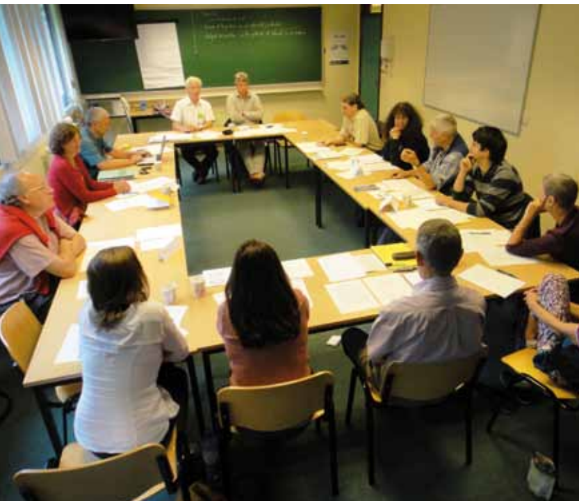
Atelier Gouvernants du Séminaire

entreprises se fasse sur base de critères transparents, et compte tenu de toutes leurs chaînes de production ou de prestations de services, à l'étranger comme en Belgique. Des certifications renouvelables de telles entreprises seraient mises à l'étude et introduites dans les meilleurs délais.