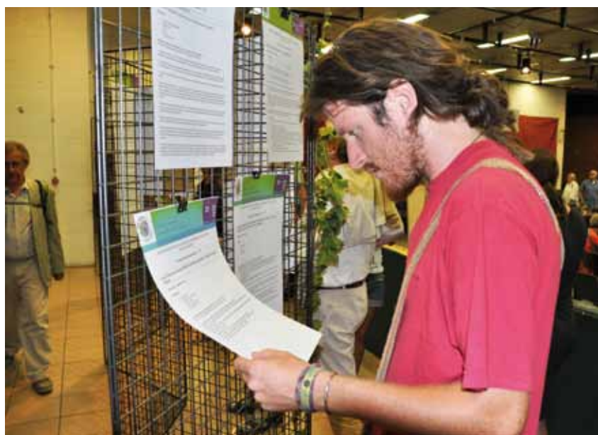
Les rapports des ateliers de l'Agora sont affichés sur le mur du Grand Journal